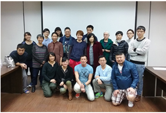
20151212 「中國女權主義發展」跨校討論會