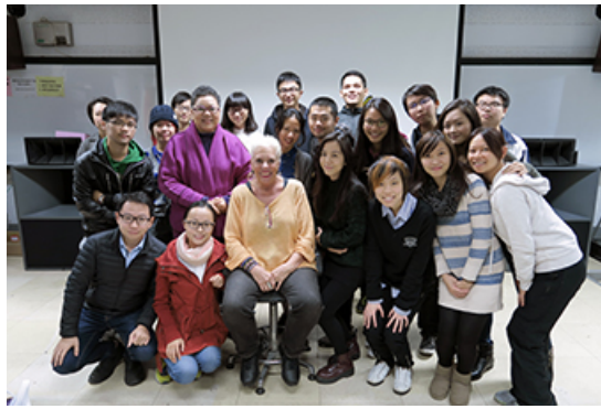
20151216 全球化與文化整編課堂演講，主題：校園性恐慌